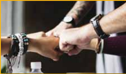
BIT-Mitgliederversammlung am 3.5.2019 NEUER VORSTAND STEHT ZUR WAHL >> S. 2