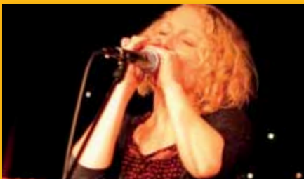
Konzert Miss Zippy & The Blues Wail + Special Workshop DELTA ROOTS & MORE >> S. 7