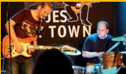
BLUES IN TOWN Sessions MAL MIT, MAL OHNE ... >> S. 8