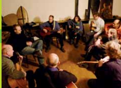
2011 und 2013, Workshop in der Blues Base im Wehrhaus