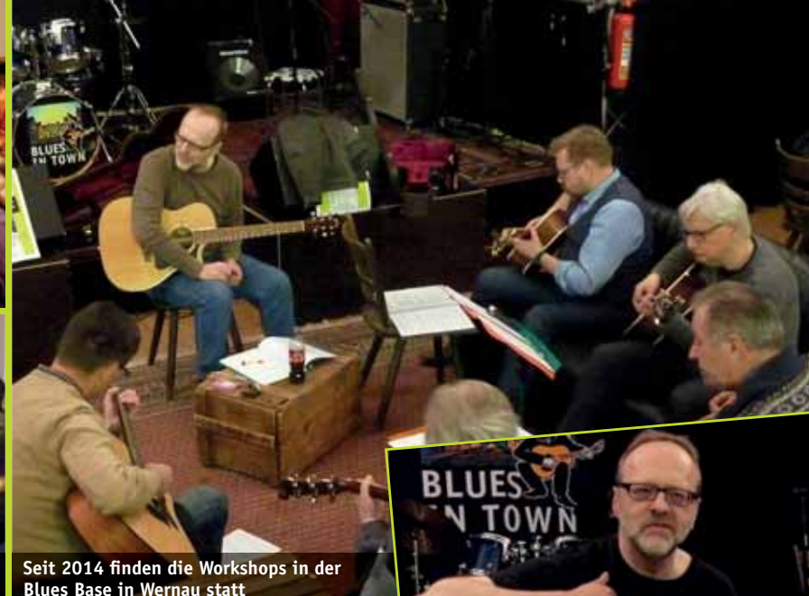
Seit 2014 finden die Workshops in der Blues Base in Wernau statt